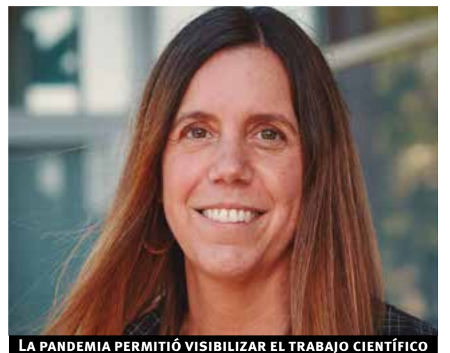
LA PANDEMIA PERMITIÓ VISIBILIZAR EL TRABAJO CIENTÍFICO