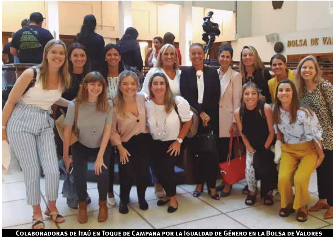
COLABORADORAS DE ITAÚ EN TOQUE DE CAMPANA POR LA IGUALDAD DE GÉNERO EN LA BOLSA DE VALORES

Con base en el diagnóstico de WEPs Gender Gap Analysis Tool identificamos nuestras brechas de