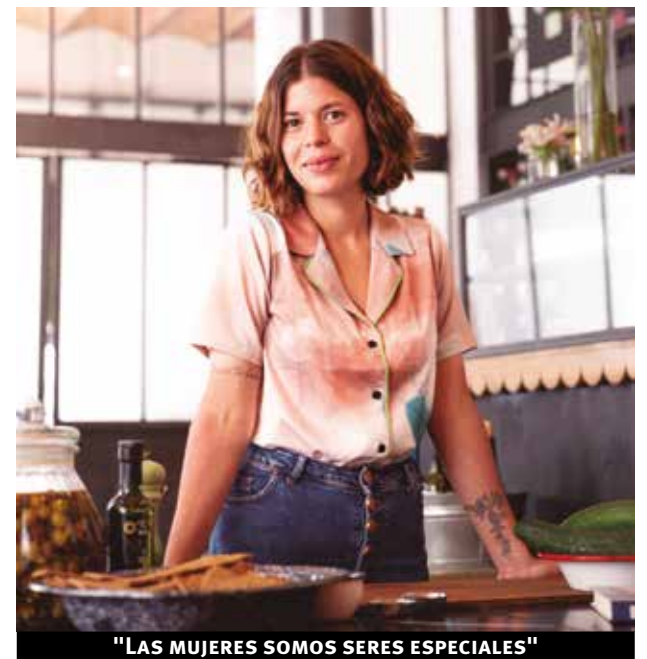
"LAS MUJERES SOMOS SERES ESPECIALES"

La calma y el ritmo de Uruguay la conquistaron. “Necesitaba tener mi espacio. Tuve la posibilidad de comprarme una casita en Garzón y fue como mi primera experiencia de