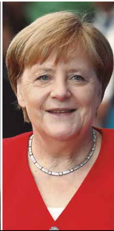
TRES MUJERES POLÍTICAS QUE LUCHAN POR LA IGUALDAD DE GÉNERO

PRODUCTOS DE HIGIENE FEMENINA GRATIS PARA ATACAR “POBREZA MENSTRUAL”