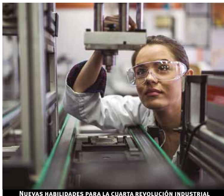
NUEVAS HABILIDADES PARA LA CUARTA REVOLUCIÓN INDUSTRIAL

La alta segregación educativa y laboral contribuye a que haya una clara diferenciación en las