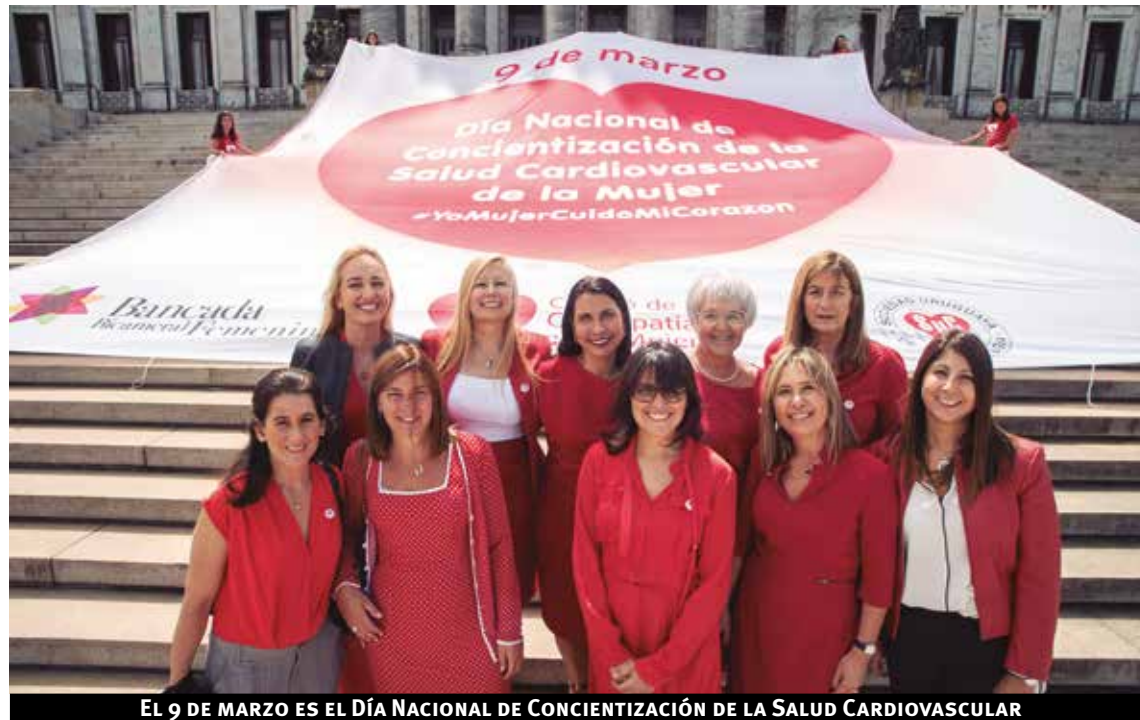
EL 9 DE MARZO ES EL DÍA NACIONAL DE CONCIENTIZACIÓN DE LA SALUD CARDIOVASCULAR

De acuerdo con la encuesta de percepción, el 51% de la muestra cree que el problema de salud más importante que afecta a la mujer es el cáncer, el 11% las enfermedades psiquiátricas y el 8% las enfermeda-