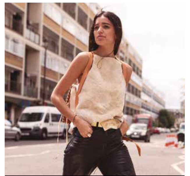
UN EMPRENDIMIENTO FAMILIAR CON PASIÓN POR EL DISEÑO

Además, hizo hincapié en que el Día Internacional de la Mujer “es un día para recordar todos los logros que han tenido las mujeres a lo largo de los años y