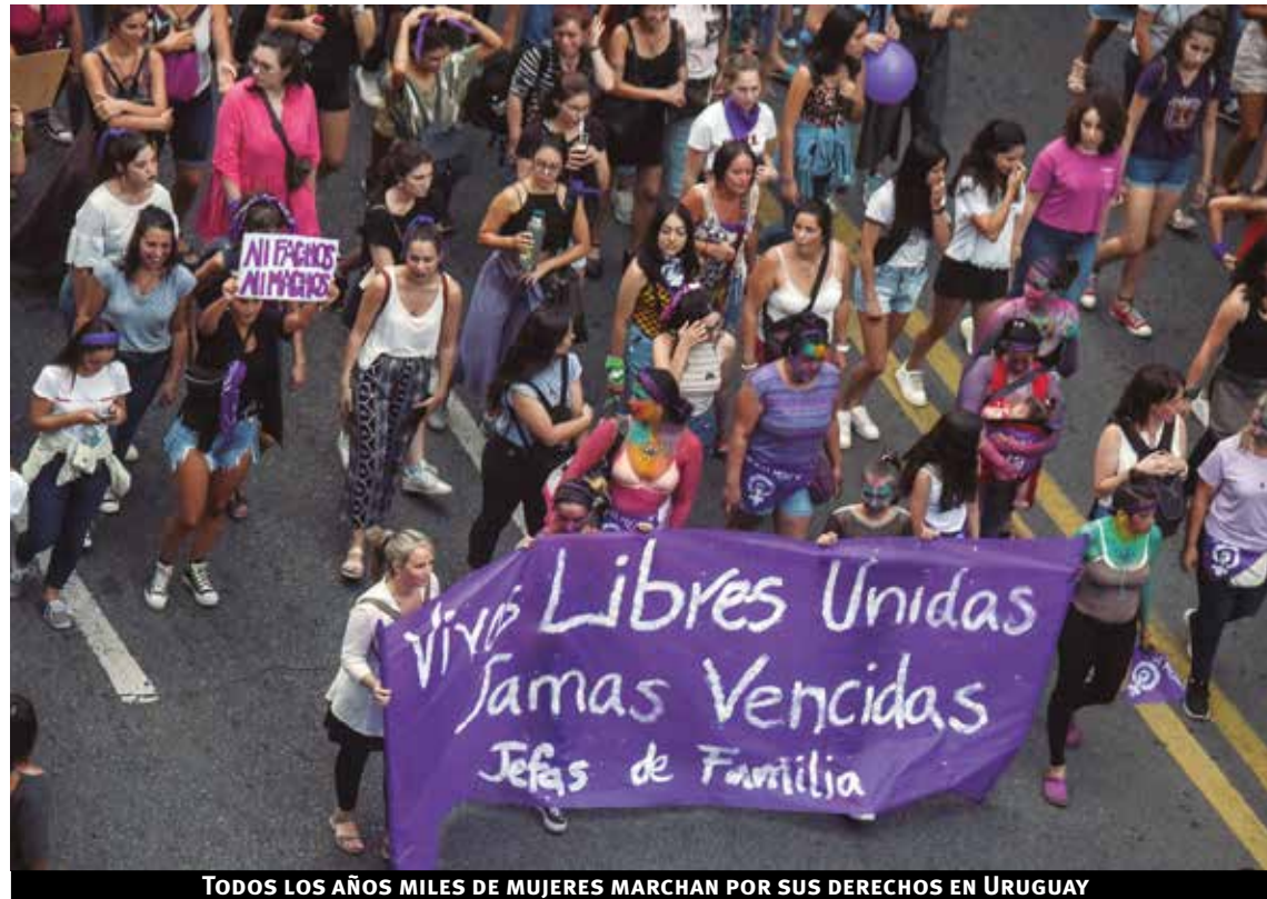
TODOS LOS AÑOS MILES DE MUJERES MARCHAN POR SUS DERECHOS EN URUGUAY

Otra de las primeras manifestaciones se llevó a cabo en 1908 en Nueva York. Alrededor de 15.000 mujeres se manifestaron y esta vez reclamaban también por el derecho al voto. En 1910, se celebró la Conferencia Internacional Socialista en Copenhague y Clara Zetkin, considerada como una de las primeras impulsoras del Día