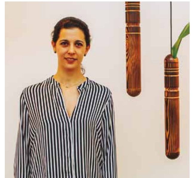
JUANA DE IBARBOUROU INSPIRÓ SU LÍNEA DE MOBILIARIO

En el proceso, alineados con su rol de madre, surgieron Littlehomes , casitas de madera para niños y