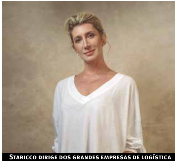
STARICCO DIRIGE DOS GRANDES EMPRESAS DE LOGÍSTICA

De allí también surgió la idea de expandir el proyecto a nivel nacional y creó la fundación La Nave, que trabaja por el empoderamiento de las mujeres desde lo económico, el cuidado, el desarrollo y también en la autoestima para que puedan elegir el camino de sus vidas. Además, brinda talleres que se expandieron a todos los jóvenes de la comunidad.