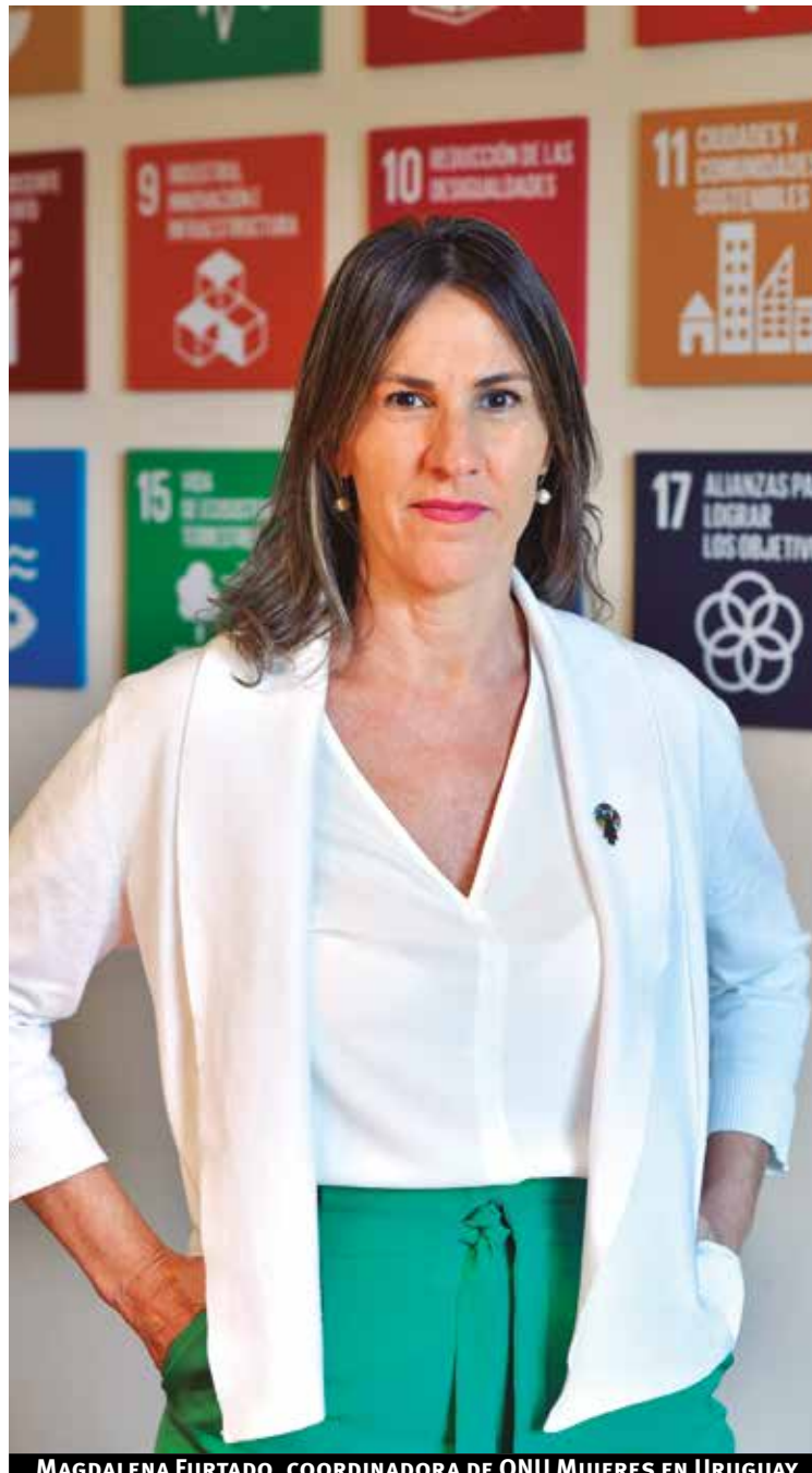
MAGDALENA FURTADO, COORDINADORA DE ONU MUJERES EN URUGUAY

El lunes ocho de marzo se realizará el evento oficial del Día Internacional de la Mujer donde se inaugurará, junto con CEPAL, la muestra “Muros a intervenir” en Fotogalería Unión. Según consigna el organismo, la exposición se basa en “una investigación periodística y fotográfica que revela cómo las instituciones y organizaciones más emblemáticas