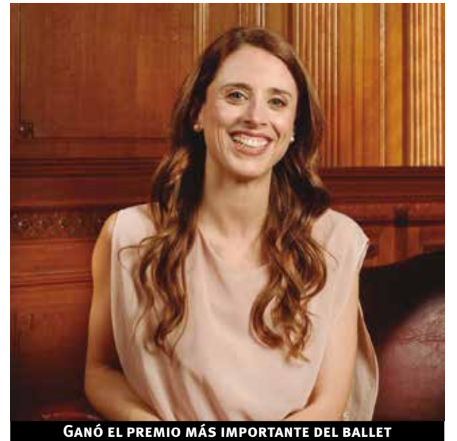
GANÓ EL PREMIO MÁS IMPORTANTE DEL BALLE

En esa línea señaló, “creo que se ha peleado y luchado