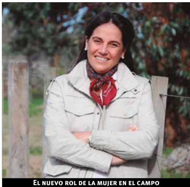
EL NUEVO ROL DE LA MUJER EN EL CAMPO

En los momentos en los que tuvo roles de decisión y dirección de las gremiales, San Martín le dio su impronta al liderazgo sobre la base de la gestión mediante el trabajo en equipos con un enfoque en el género.